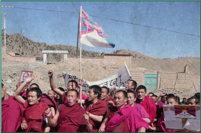
ཕྱི་ལོ་ ༡༠༠༩ ལོར་ཨ་མདོ་རེབ་གོང་དུ་བོད་མི་དགེ་འདུན་པ་རྣམས་ཀྱིས་ཞི་ཚེལ་རམ་སྐོན་བྱེད་ བཞིན་པ།

གཤམ་རྟོགས་བྱུང་བ་ལྟར་ན། ཕྱི་ལོ་ ༡༠༠༧ ནས་བཟུང་བོད་མི་ ༡༥༥ ཙམ་གྱིས་བོད་ལ་རང་དབང་དགོས་པ་དང་། ཡུལ་བ་རིན་པོ་ཆེན་བོད་ལ་ གདན་འདྲེན་ལུ་དགོས་སོགས་ཀྱི་འབོད་ཚིག་སྒྲིག་བཞིན་རང་ལུས་ལུགས་ འབྲུལ་གནང་ཡོད། གནས་ཚུལ་དེ་ཡང་རྒྱ་ནག་གཞུང་གི་བོད་ནང་དབང་ རྒྱུར་བྱས་ནས་ལོ་ངོ་བཅུ་ཕྲག་ཁ་གསུམ་རྗེས་སུ་བྱུང་ཡོད།