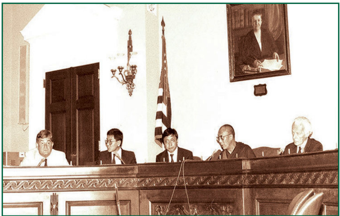
ལྷོ་ལོ་ ༡༩༤༧ ལོར་ལ་ཤོང་ས་ལ་སྐྱབས་མགོན་ཆེན་པོ་མཆོག་གིས་ཨ་རིའི་གྲོས་ཚོགས་ཀྱི་འགོ་བ་ མའི་ཐོབ་ཐང་ཚོགས་ཚུངས་ཐོག་ཞི་བའི་དོན་ཚན་ལྟ་གསལ་བསྐྱབས་རྒྱུ་རྟོགས་ལྟར།

ལྷོ་ལོ་ ༡༩༤༧ ལོར། ལ་ཤོང་ས་ལ་སྐྱབས་མགོན་ཆེན་པོ་མཆོག་ནས་ཨ་ རི་གྲོས་ཚོགས་སུ་སྤྲུགས་ཀྱི་འཆར་རྒྱུ་ཞི་བའི་དོན་ཚན་ལྟ་གསལ་བསྐྱབས་ བསྐྱུངས་པ་དང་། དེའི་དོན་ཚན་ལྟ་པའི་རྒྱས་བཤད་དུ་སི་ཏུས་ལྷག་གི་ གྲོས་འཆར་ལྷོ་ལོ་ ༡༩༤༤ ལོར་ཡོ་རོབ་གྲོས་ཚོགས་སུ་གསལ་བསྐྱབས་ བསྐྱུངས་ཡོད། གྲོས་འཆར་འདི་དབུ་མའི་ལམ་གྱི་སྲིད་བྱས་ཀྱི་རྒྱས་བཤད་ དང་པོ་ཡིན་ལྟར། གསལ་བསྐྱབས་མ་གཞན་གོང་ལྷོ་ལོ་ ༡༩༤༤ ལོ་ ༤