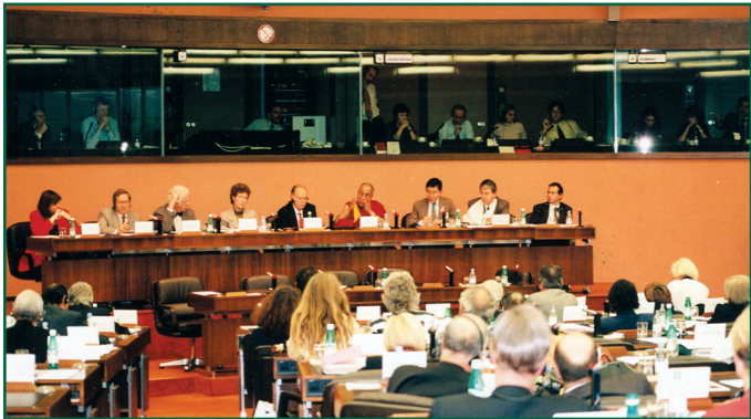
ཕྱི་ལོ་ ༡༩༩༩ ལོར་ཡཁོང་ས་ཡ་སྐབས་མགོན་ཆེན་པོ་མཚོག་གིས་ཡོ་རོབ་གྲོས་ཚོགས་སུ་སྤྲོས་ རྒྱག་གྲོས་འཆར་གསལ་བརྒྱགས་སྤྱིང་སྐབས།

ཚེས་ ༦ ནས་ཚེས་ ༧ བར་ཉིན་བཞིའི་རིང་ལྷ་སར་དམིགས་བསལ་ཆབ་ སྲིད་ཚོགས་ཚེན་ནང་བགྲོ་སྐྱོང་མཐེལ་ཕྱིན་རྗེས་གྲོས་འཆར་དེ་རང་གསལ་ བརྒྱགས་གནང་རྒྱ་སྤྲོད་མེད་ཀྱིས་རྒྱབ་གཉེར་གནང་ཡོད།