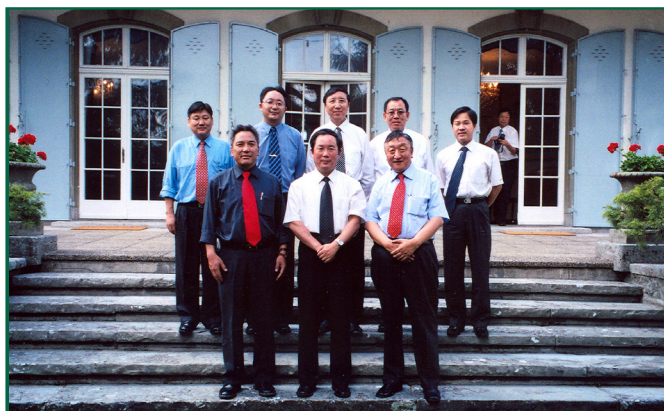
ཕྱི་ལོ་ ༢༠༠༥ ཟླ་ ༦ ནང་ ༢ པའི་ནང་སྲུང་སི་རྒྱལ་ས་རྒྱན་དུ་ཡོད་ཀྱི་འབྲེལ་མོལ་ཐེངས་པའི་རྒྱབ་སྐྱོལ།