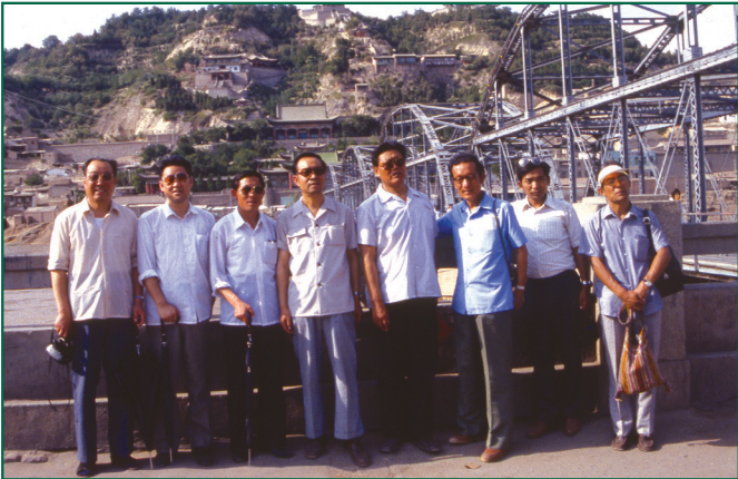
ཕྱི་ལོ་ ༡༩༥༥ ལོར་སྐུ་ཚབ་གཟིགས་སྐོར་ཐངས་བཞི་པའི་སྐུ་ཚབ་ནམ་པ་ལན་ཀུའུ་རུ་ཚུ་རིགས་ལས་བྱེད་དང་ལྟན།