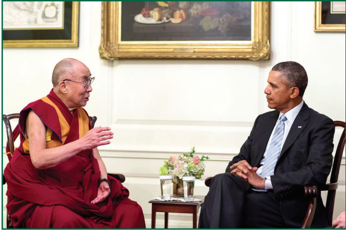
ལ་ཁོང་ས་ཡ་སྐབས་མགོན་ཆེན་པོ་མཚོག་དང་ཨ་རིའི་སྲིད་འཛོན་ཟུར་པ་ཨོ་ལྷ་མ་ལྷོན་སྐུ་པར།

ང་ཚོའི་མཚེད་གོགས་ལ་ལོང་ས་ཡ་སྐབས་མགོན་ཏུ་ལའི་ལྷ་མས་ཞི་མོ་ལ་གྱི་ལམ་ ཅས་དཀའ་རྙོག་སེལ་ཐབས་མངོན་གྱི་ཡོད། ཁོང་གིས་ཁ་བྲལ་ནམ་ཡང་རྩོད་ གནང་གི་མེད་པ་མ་ཟད། མཐའ་གཅིག་དུ་འཚོ་མེད་ནི་བའི་ཐབས་ལམ་ཉམས་ བཞེས་མངོན་མཁན་ཞིག་ཡིན་སྐབས། རྒྱ་ནག་གཞུང་གིས་དོན་སྣང་ལྡན་པའི་ འབྲེལ་མོལ་བྱ་རྒྱའི་གོ་སྐབས་བཟང་པོ་འདི་ཚུད་ཟོས་སུ་མ་སོང་བའི་འབོད་ སྐུལ་ནན་པོ་ཞུ་རྒྱུ་དང་། བོད་མིའི་ཆེ་མཐོང་ལ་བརྩི་བཀུར་དང་རྒྱ་ནག་གི་ཆེག་ རྒྱུལ་ལ་ཆ་འཛོན་ཞུས་པའི་སློན་ནས་ད་ལྟོ་བོད་ནང་གི་ངོ་དྲག་དཀའ་ངལ་རྣམས་ སེལ་ཐབས་སུ་གཉིས་མོས་དང་གྲུ་ཡངས་ཐོག་ནས་འབྲེལ་མོལ་བྱེད་དགོས་པ་ སོགས་འཁོད་ཡོད།