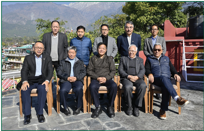
དཔལ་ལྷན་སྲིད་སྐྱོང་སློབ་པ་ཆེ་རིང་མཆོག་དང་ཐབས་བྱས་འཆར་འགོད་ཚོགས་ཚུང་གི་ཚོགས་ མི་ལྟན།

༢༠༢༠ ཨ་རིའི་གྲོས་ཚོགས་ནས་ཕྱི་ལོ་ ༢༠༢༠ ལོར་པོད་དོན་སྲིད་བྱུས་ དང་རྒྱབ་སྐྱོར་བྲིམས་འཆར་གཏན་འབེབས་གནང་བ་དེས་སྤྱི་ནོར་ཡགོང་ ས་ལ་སྐྱབས་མགོན་ཆེན་པོ་མཆོག་གི་ཡང་སྲིད་གནད་དོན་དང་། པོད་ནང་ རྒྱ་ནག་གཞུང་གིས་པོད་མི་རྒྱལ་ལ་མུ་མཐུད་དྲག་གཞོན་གྱིད་བཞིན་པའི་ གནད་དོན་སོགས་ལ་གཤིང་ལེན་གྱིས་ཨ་རིས་པོད་དོན་ལ་རྒྱབ་སྐྱོར་གནང་ ཚད་མཐོ་རུ་བཏང་བ་མ་ཟད། བྲིམས་འཆར་དེ་བརྒྱུད་ཨ་རི་གཞུང་དོན་ རས་པོད་མིའི་སྤྱི་གཞུང་གསུང་དང་དབྱ་མའི་ལམ་སྲིད་བྱུས་ལ་དོན་འཛིན་ བཏན་པོ་གནང་ཡོད།