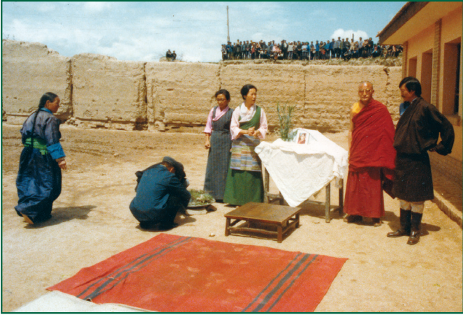
ཕྱི་ལོ་ ༡༩༥༠ ལྷ་མོ་ནང་སྐུ་ཚབ་གཟིགས་སྐོར་ཐངས་གསུམ་པའི་སྐུ་ཚབ་ནམ་པ་ཨ་མདོ་སྐག་འཆེར་དུ་གཟིགས་སྐོར་ཡེབས་སྐབས།